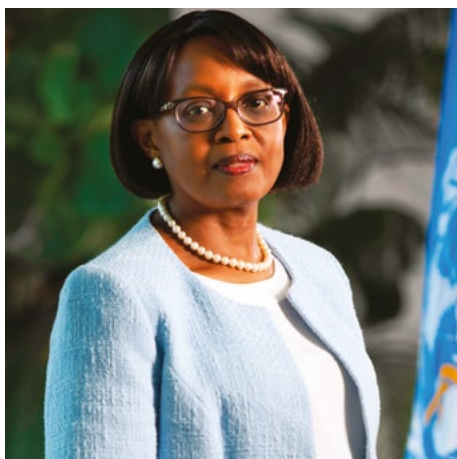
Dr Matshidiso Moeti

Directrice régionale de l'OMS pour l'Afrique